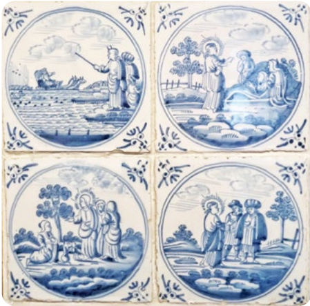
Blauwe Bibelfliesen in der Pfarrhausküche, Motive: Durchzug durchs Schilfmeer - Untergang Pharaos (Mose hat immer „Hörnchen“), Jesus im Garten Gezemane, Emmausjünger (Jesus hat immer einen Heiligenschein), Rotterdam 1750