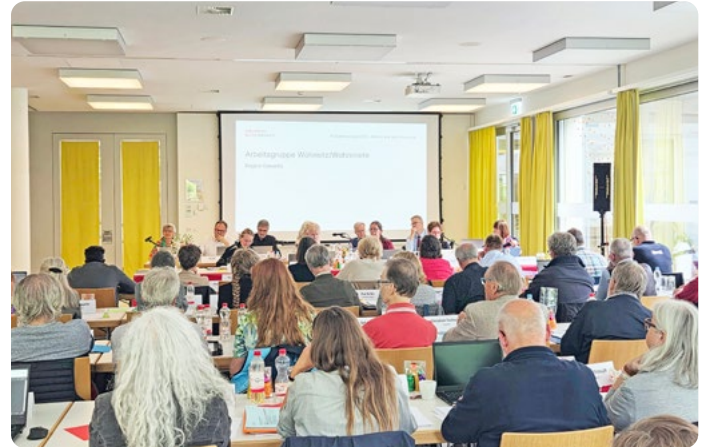
Synode-Tagung im Seniorenzentrum Rosengarten in Laufen.

Eröffnet wurde die Synode mit einem Gottesdienst in der reformierten Kirche Laufen unter dem Leitwort «Siehe, ich mache alles neu». Die Botschaft von Erneuerung und Hoffnung bildete den passenden Rahmen für die Beratungen des Tages. Gleichzeitig stand die Tagung im Zeichen der Trauer um den kürzlich verstorbenen Co-Präsidenten der Synode, Dieter Hofer. Mit einer Schweigeminute und einer Kerze an seinem Platz wurde seines langjährigen Engagements gedacht.