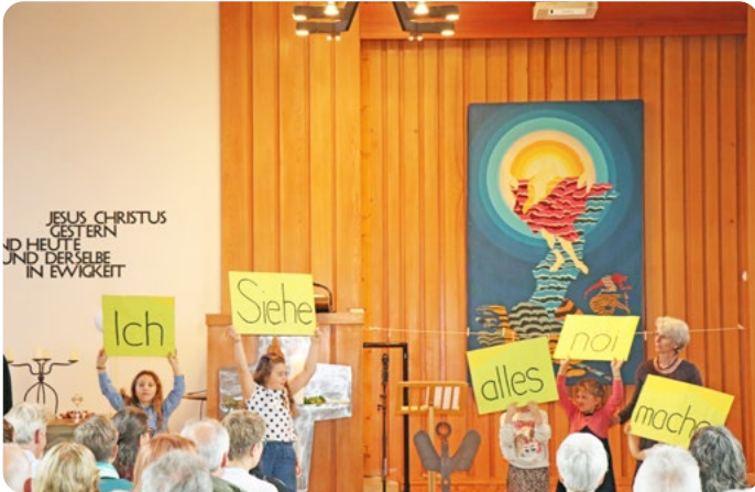
Kinder begleiten den Gottesdienst und leiten thematisch die Verheissung «siehe ich mache alles neu».

Die Frühjahrssynode der Reformierten Kirche Baselland tagte am 10. Juni 2026 in Laufen. Im Mittelpunkt standen die neuen Legislaturziele des Kirchenrats, die Jahresrechnung 2025 sowie Fragen zur zukünftigen Entwicklung der Kirche in einer sich wandelnden Gesellschaft.