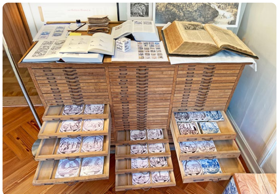
Bibelfliesen-Schubladenschrank im Reigoldswiler Pfarrhaus

Mehr Infos und Führungs-Anfragen: Dorothee Löhrl: pfarramt@reigoldswil.ch